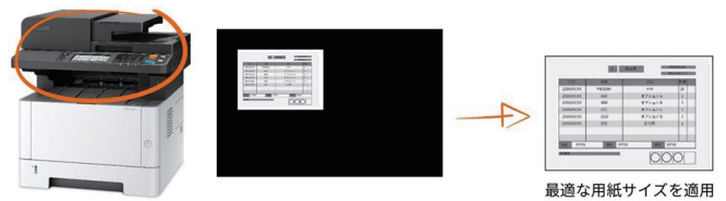
最適な用紙サイズを適用