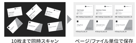
10枚まで同時スキャン

※ECOSYS MA4500ifx/MA4000wifx対応。別途、SDカードもしくはストレージオプションが必要です。