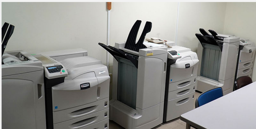
各現場に合ったプリンターや複合機を配置