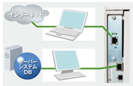
※オプションのネットワークインターフェイスを装着

インターネットにつながる社内の一般ネットワーク出力とセキュアな専門業務ネットワーク出力を一台で。こうした要望に応え、2つネットワークのインターフェイスに対応が可能です。一台二役を実現します。